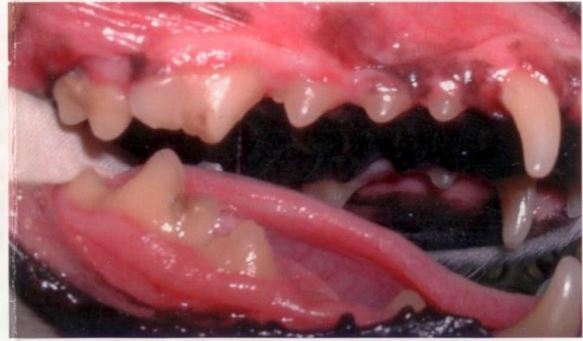
Chien croisé , 14 14 ans, 8 kg, soin dentaire quotidien.